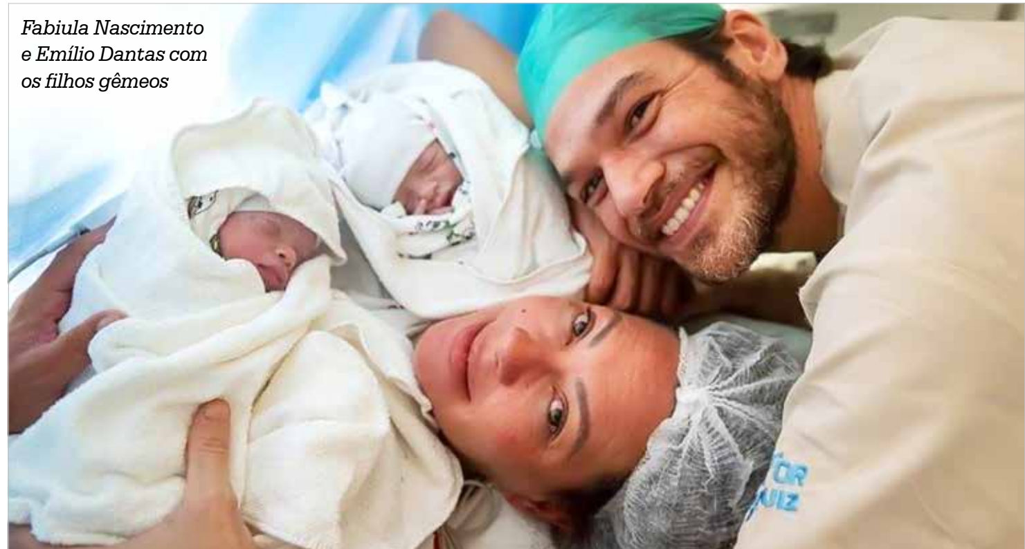
Fabiula Nascimento e Emilio Dantas com os filhos gêmeos