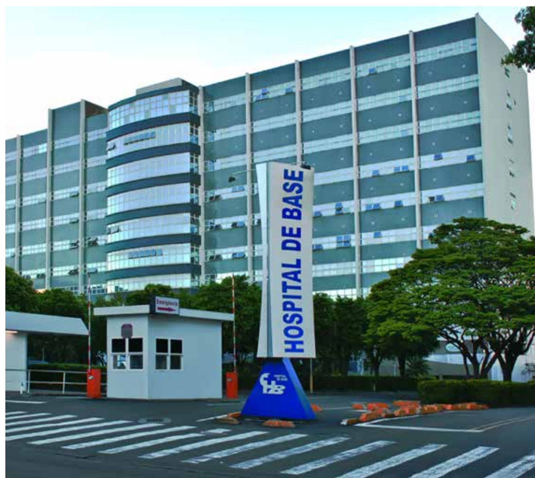
Na UTI Covid, 19 dos 41 leitos estão ocupados

São Paulo aguarda o envio de imunizantes pediátricos da Pfizer por parte do Ministério da Saúde, aprovado desde 16 de dezembro pela Anvisa (Agência Nacional de Vigilância Sanitária), para que possa iniciar o plano de vacinação do público infantil.