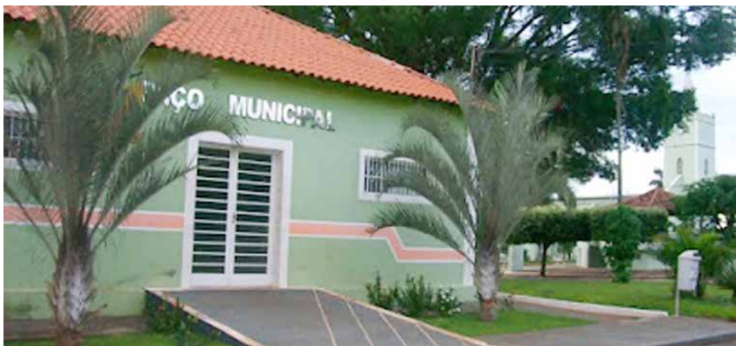
Sede da Prefeitura de Pedranópolis