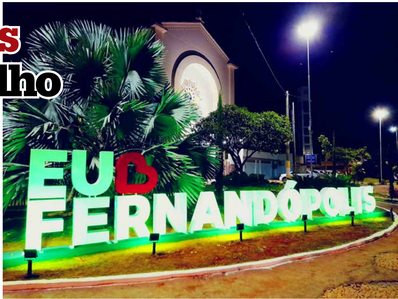
A Praça da Matriz ganhou a instalação do letreiro "Eu Amo Fernandópolis"

Dentro das comemorações do aniversário de Fernandópolis, o Fundo Social de Solidariedade mais uma vez estará em destaque na próxima