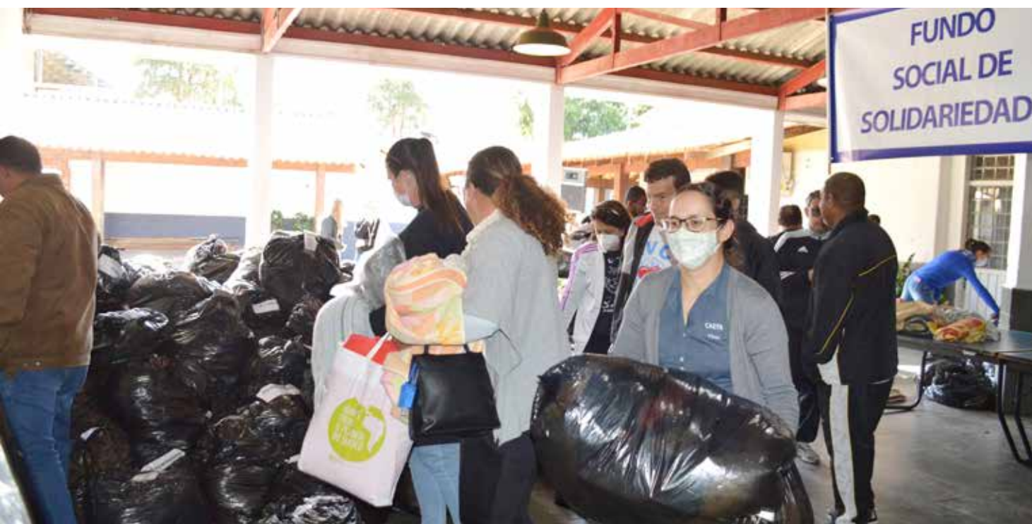
A entrega das doações aconteceu na manhã da última terça-feira