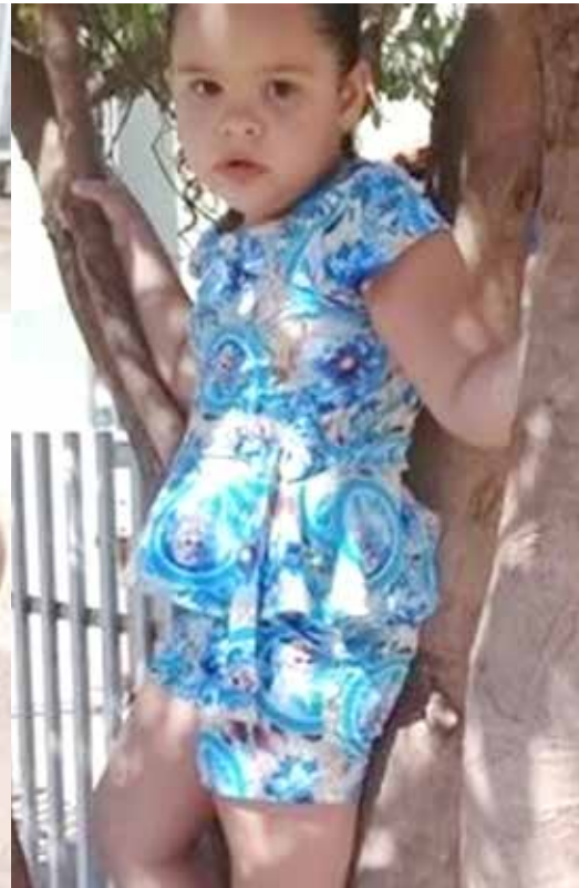
A Polícia Militar foi acionada e investiga o caso

com bichinhos. A Polícia Militar foi acionada e investiga o caso.