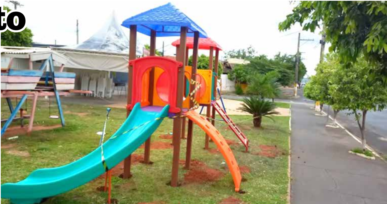
Oito locais já receberam novos brinquedos em Fernandópolis

Na última semana, um novo playground foi instalado na avenida Rubens Padilha Meato, na praça localizada entre os bairros Cohab Antônio Brandini e Santa Cecília.