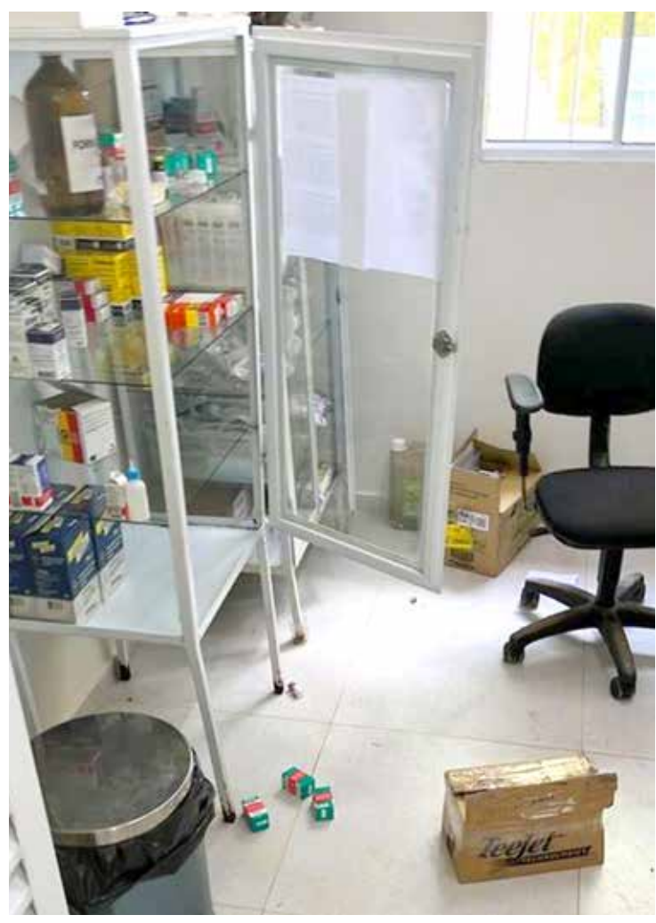
Imagens da destruição no Centro de Zoonoses