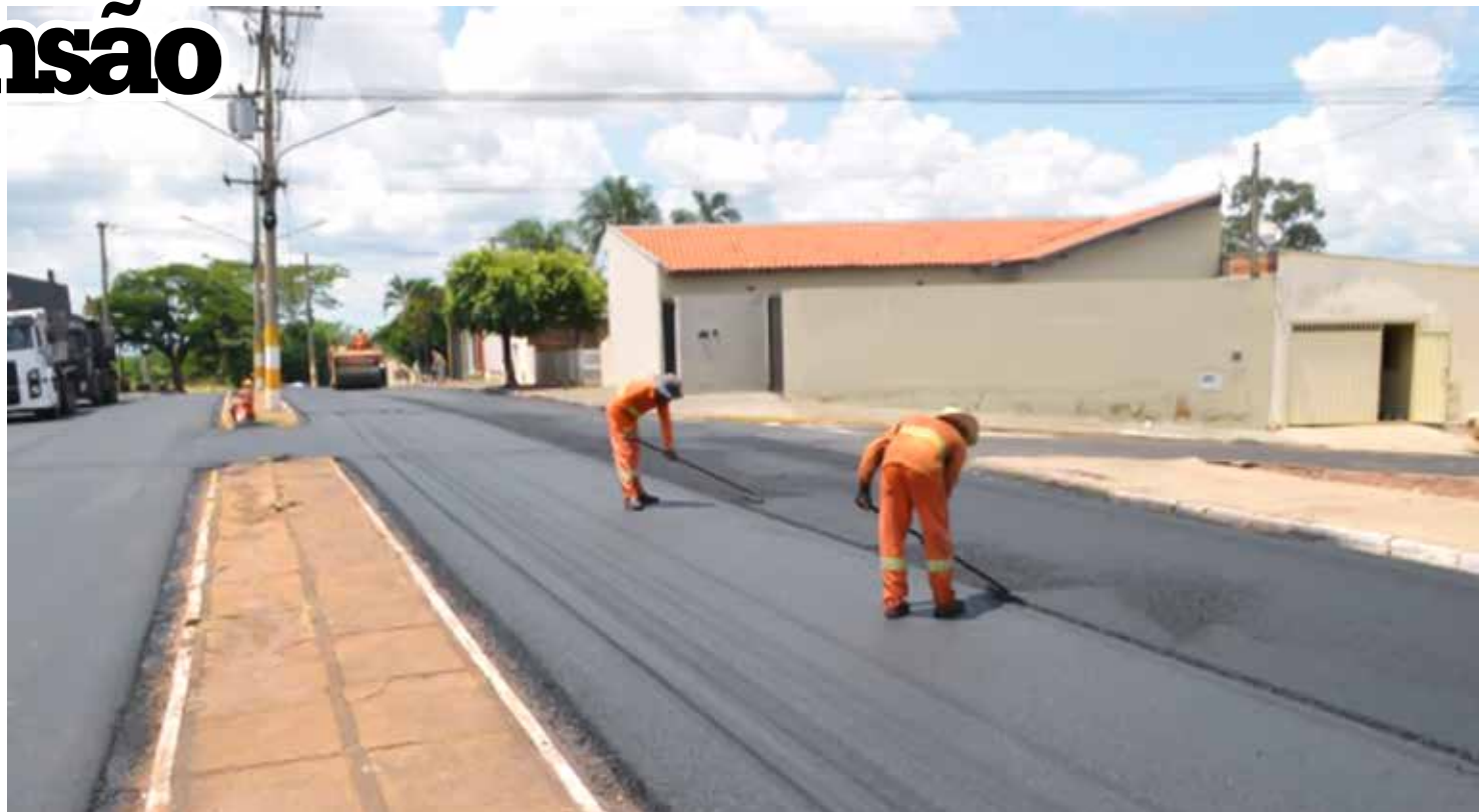
Recape é convênio entre Prefeitura e Governo Estadual

Obra de 35 mil metros quadrados, tem valor aproximado de R$ 2,7 milhões