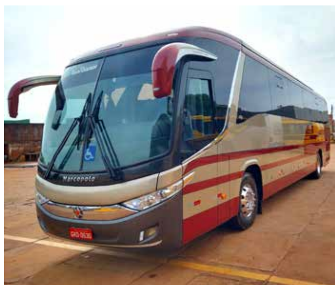
É a maior aquisição e conquistas de veículos 0Km na história do município

Cada turno de votação é contabilizado como uma eleição