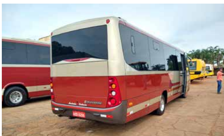
O veículo tem capacidade para transportar até 28 passageiros