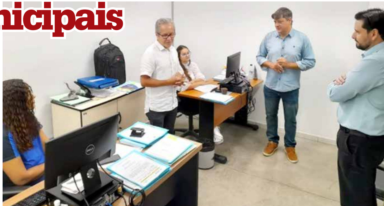
Chefes do Executivo e Legislativo durante visita a secretarias municipais

Os chefes dos poderes executivo e legislativo visitaram algumas secretarias, em especial as que demandam mais projetos