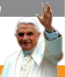
Papa Bento XVI

“O amor supera a justiça. Justiça é dar ao outro o que é dele, amor é dar ao outro o que é meu”.