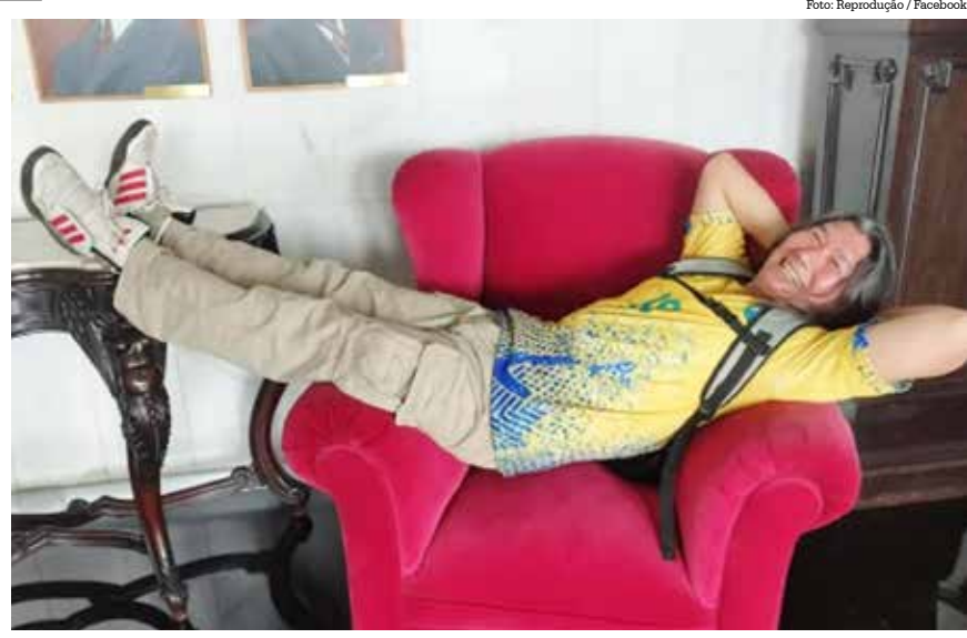
O votuporangense participante da invasão ‘relaxa’ em um sofá no Congresso

Paula conta, em história verificada com outras fontes da cidade, frequentadores da cena alternativa de rock, que antes do bolsonarismo Kingo gabava-se de ser um vagabundo, que nunca precisou trabalhar, mas que, depois de Bolsonaro, quando trocou as camisetas do