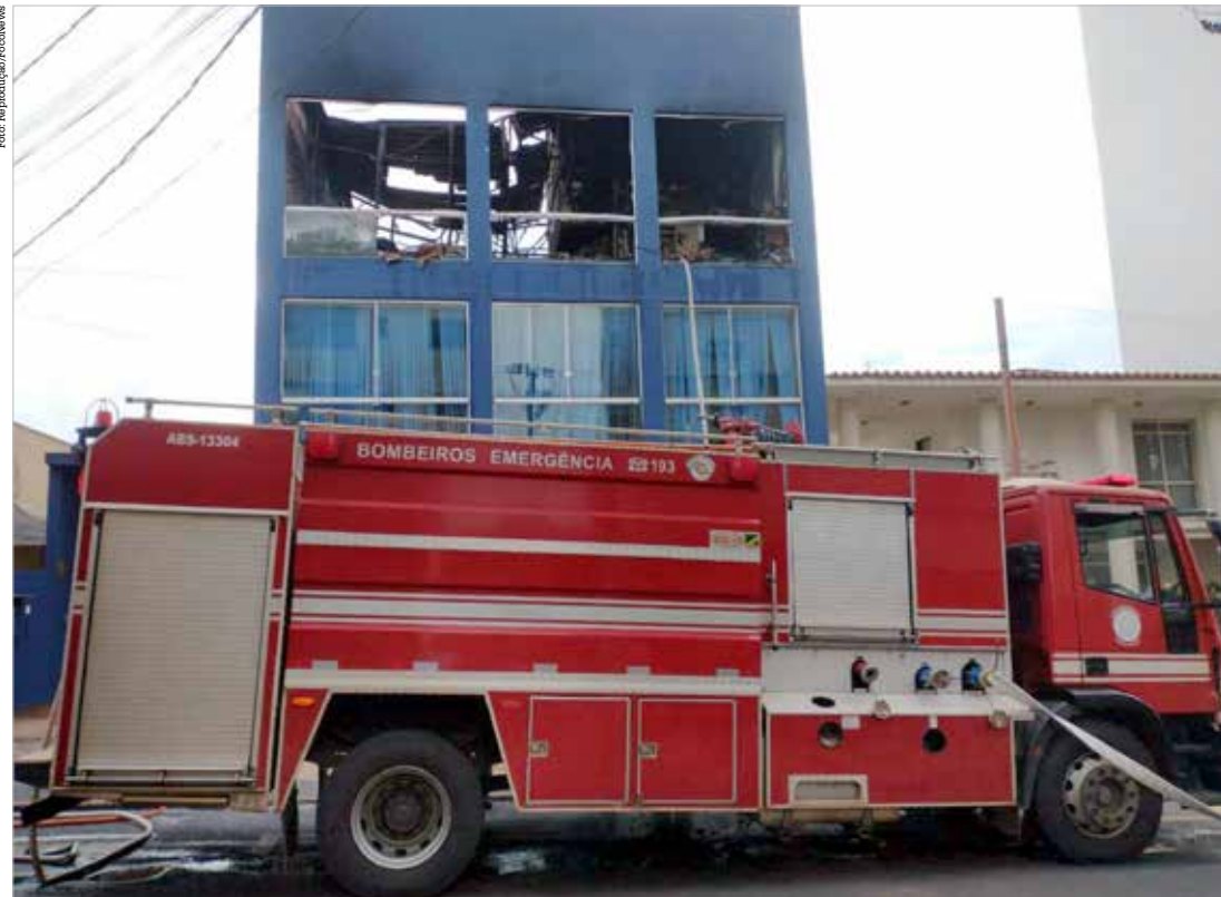
Não foram registrados feridos nesta ocorrência