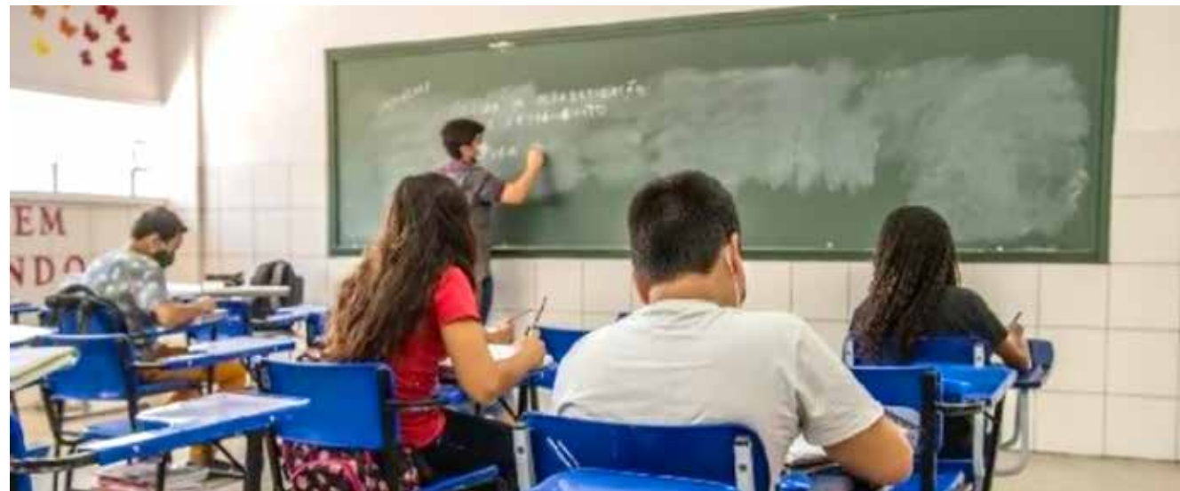
O valor considera uma jornada de 40 horas semanais na modalidade normal de ensino

tério deve ser corrigido todos os anos pelo crescimento do valor anual mínimo por aluno referente aos anos iniciais do