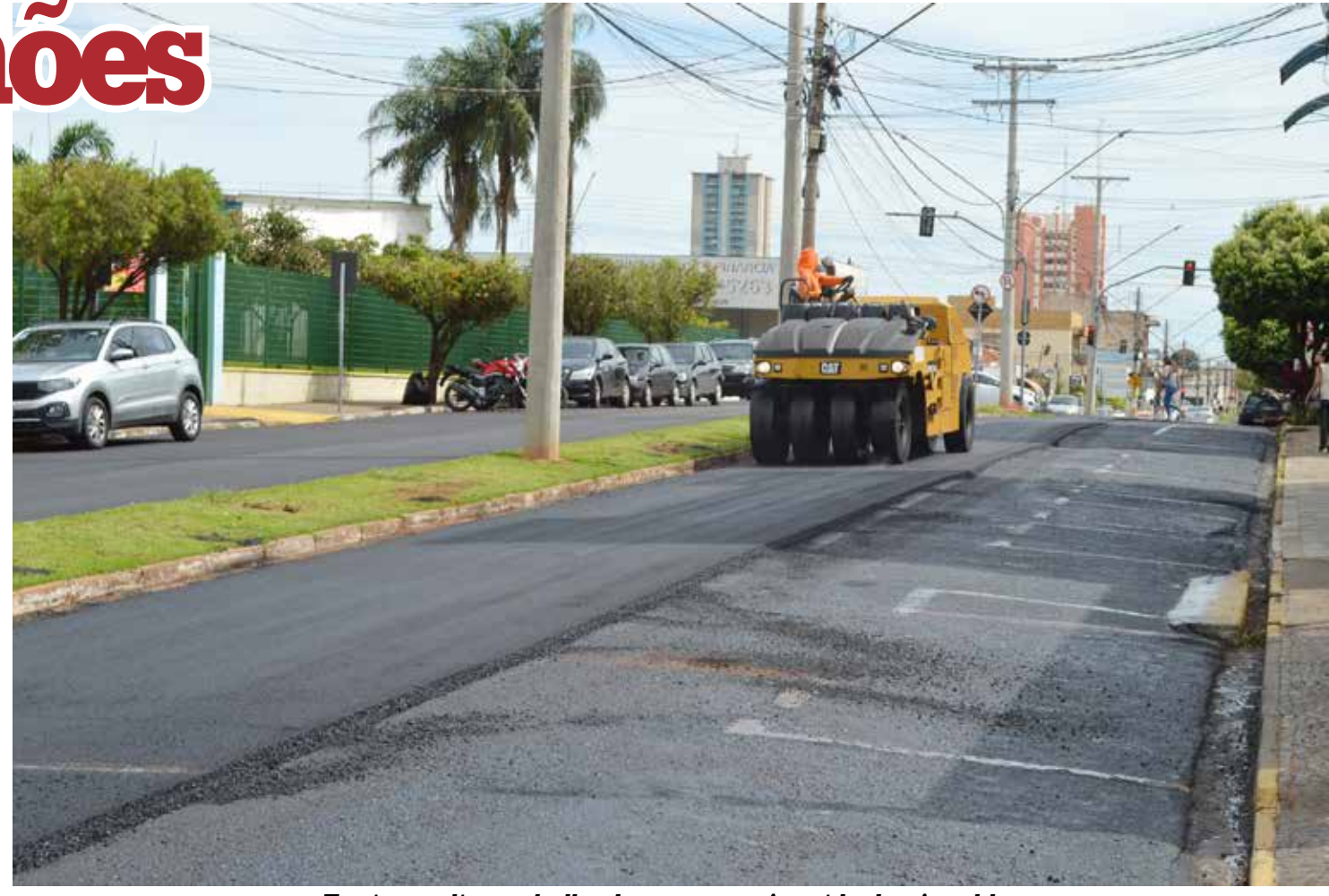
Equipe realiza trabalho de recape na Avenida dos Arnaldos