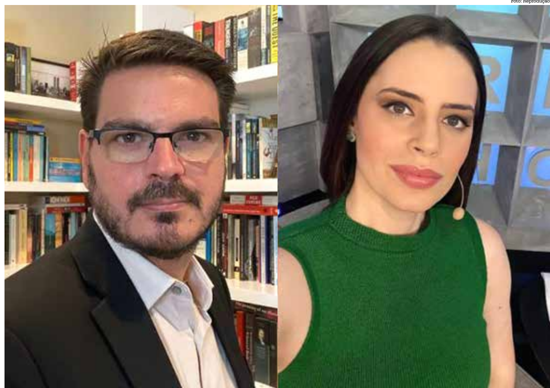
A informação foi confirmada pela assessoria de imprensa da emissora

O inquérito justifica que os conteúdos veiculados podem abalar a confiança do público nas instituições. “Numerosos conteúdos desinformativos, entre reportagens, debates ao vivo e comentários no formato de coluna e opinião têm potencial para minar a confiança dos cidadãos