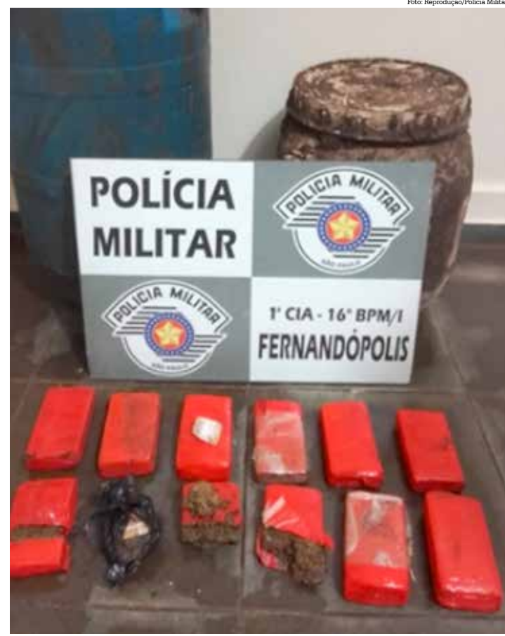
Drogas e celular apreendidos

Ao todo, foram apreendidos quatro quilos de