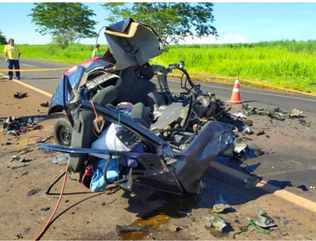
Veículo ficou totalmente destruído

O menor foi encaminhado ao Plantão Policial, ficando à disposição da Justiça.