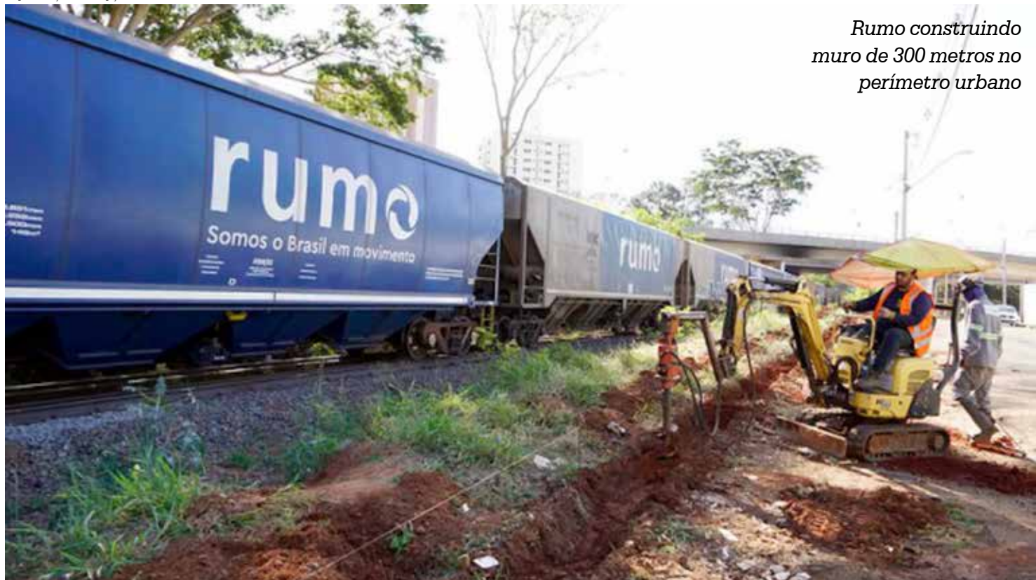
Rumo construindo muro de 300 metros no perímetro urbano

Imagem: Ilustração