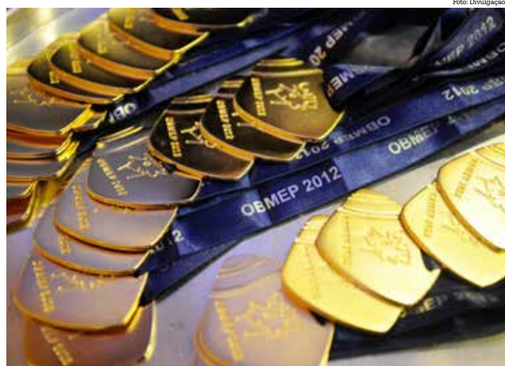
Todos os medalhistas estão convidados a participar da edição 2024 do Programa de Iniciação Científica Jr.