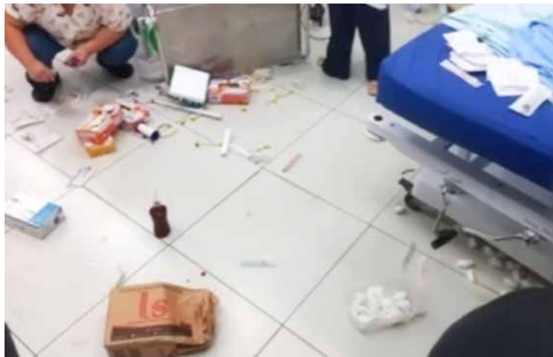
Vandalismo na sede da UPA de Fernandópolis

Após ele foi novamente medicado. A ocorrência foi neste último final de semana, sendo que o acusado é morador do município de Parisi e foi encaminhado a UPA após se envolver em um acidente