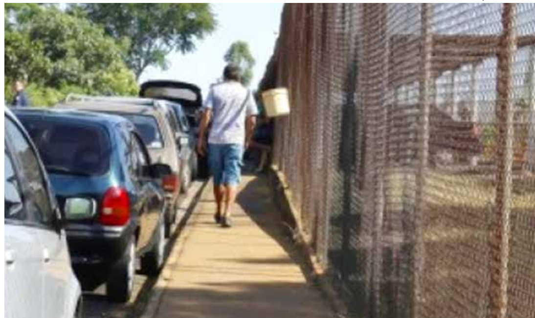
Movimentação em unidade prisional de Rio Preto às vésperas de final de ano

Não há informações oficiais quanto ao número de presos liberados que estarão sendo monitorados através de tornozeleira eletrônica. Na 'Saidinha de São João', em junho passado, 61 presos não retornaram e outros 39 descumprem regras. Tais números são apenas do Centro de Progressão Penitenciária (CPP) Dr. Javert de Andrade (Rio Preto).