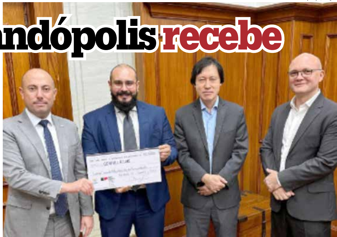
Provedor recebendo a premiação na Secretaria da Fazenda

Junto com a entidade local, outras quatro que prestam serviços assistenciais também vão encerrar 2023 com o caixa reforçado. Foram sorteadas pela Nota Fiscal Pau-