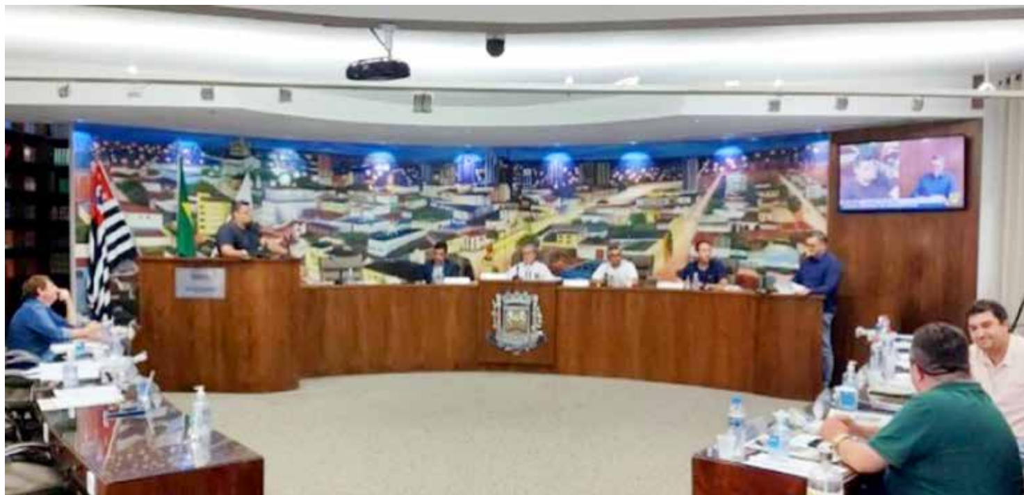
Vereadores durante a última sessão ordinária de 2023

Os vereadores da Câmara Municipal de Fernandópolis realizaram na última quinta-feira, 21 de dezembro, a última sessão ordinária do ano de 2023.