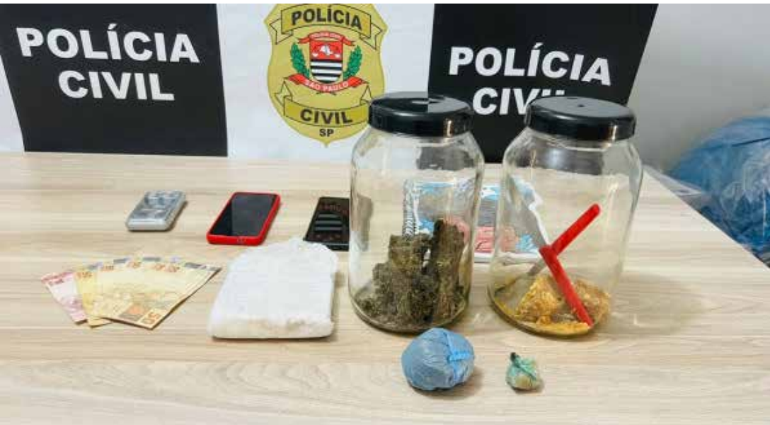
Drogas, aparelhos celulares e dinheiro encontrados pela Polícia Civil

Foram localizados na residência dos acusados aproximadamente 270 gramas maconha