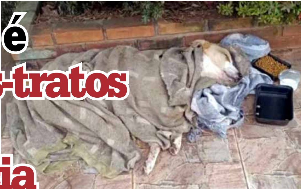
Cão não resistiu e acabou morrendo após socorro

Intervenção da Polícia Militar e do Centro de Zoonoses