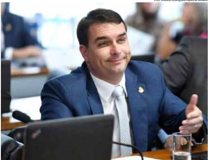
Flávio Bolsonaro: o escolhido

rança das famílias sendo apagada e nossa democracia sucumbindo.” INDICAÇÃO FEITA DURANTE VISITAS NA POLÍCIA FEDERAL Preso desde 22 de novembro na Superintendência da Polícia Federal em Brasília, Bolsonaro tem recebido apenas familiares, advogados e pessoas previamente autorizadas. Em uma dessas visitas, segundo interlocutores, o ex-presidente teria apontado o filho mais velho como o nome para enfrentar o presidente Luiz Inácio Lula da Silva