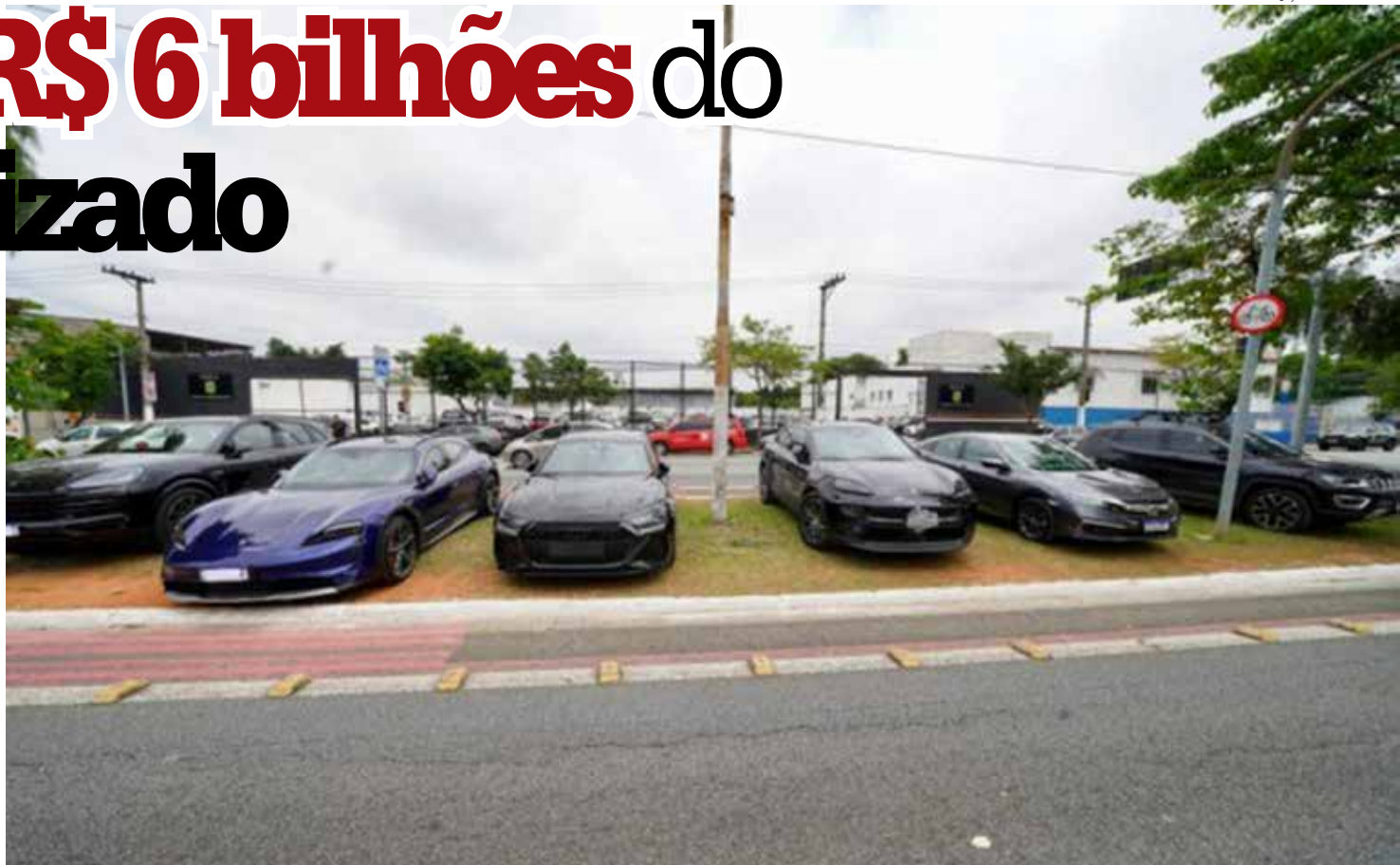
Veículos de luxo apreendidos em operação da Polícia Civil

As apurações revelaram que o grupo, ligado diretamente ao Primeiro Comando da Capital (PCC), operava um esquema sofisticado de lavagem de dinheiro e atuava como