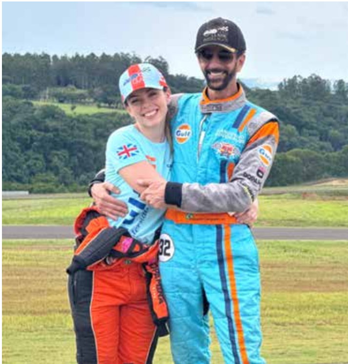
O vice-campeão, junto com a filha, no Raceville, em Brotas

O piloto multi-campeão da categoria Stock Car Ingo Hoffman marcou presença no evento que é homologado pela Confederação Brasileira de Automobilismo (CBA).