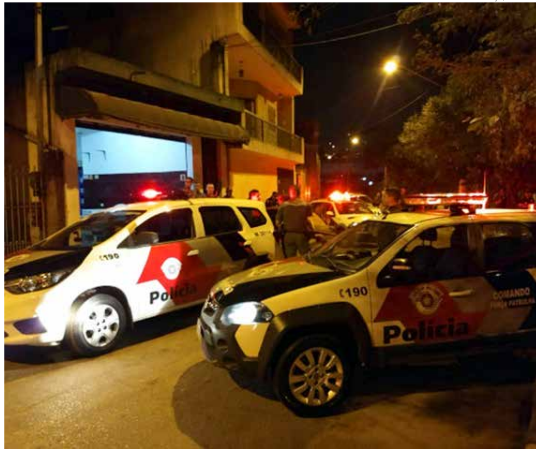
Polícia Militar atende à ocorrência

O caso segue registrado e será acompanhado pelos órgãos competentes.