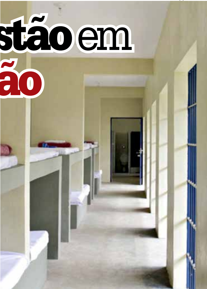
Ala do sistema prisional estadual

As forças de segurança informaram que o monitoramento dos detentos liberados será mantido durante todo o período da saída temporária. O descumprimento das regras impostas pela Justiça — como consumo de bebidas alcoólicas, frequência em locais proibidos ou o não retorno na data estipulada — resulta na perda imediata do regime semiaberto.