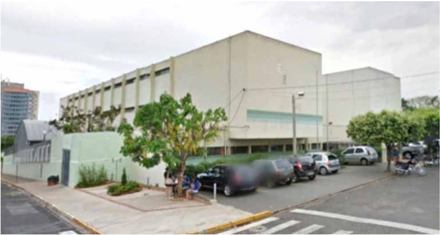
Escola Líbero de Almeida Silveiras (EELAS), situada no bairro Santa Helena, em Fernandópolis, foi uma das selecionadas

O Governo do Estado de São Paulo confirmou que a implementação do programa de escolas cívico-militares na rede estadual de ensino terá início em fevereiro de 2026, com a adoção do modelo em 100 unidades escolares já no primeiro ano. De acordo com a administração estadual, a previsão inicial era que o programa começasse no segundo semestre de 2025. No entanto, a implantação acabou sendo suspensa após decisão do Tribunal de Justiça de São Paulo (TJ-SP). Posteriormente, o ministro Gilmar Mendes, do Supremo Tribunal Federal (STF – Supremo Tribunal Federal), derrubou a proibição e auto-