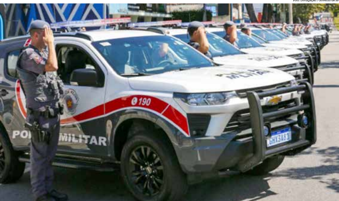
Prisões envolvem delitos como tentativa de estupro e homicídio, roubo e furto