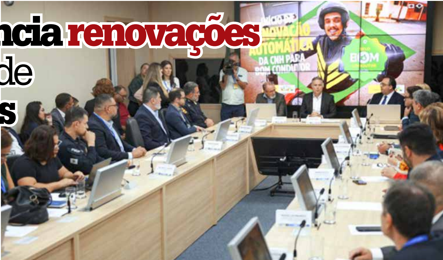
O ministro dos Transportes, Renan Filho, durante cerimônia que oficializa medida administrativa que autoriza a renovação automática da Carteira Nacional de Habilitação (CNH) para bons motoristas

primeiro lote de CNHs renovadas automaticamente, Renan Filho disse que uma mensagem será enviada, por celular, aos bons condutores parabenizando-os pelo feito e concedendo, a eles, um selo.