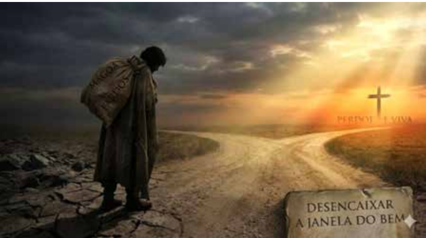
Imagem: Ilustração / Fonte: LA

bastante força para lavar-se nas águas vivas da grande compaixão. Quem não perdoa os erros dos semelhantes, condena a si mesmo. Quem não olvida as ofensas, transforma-se num fardo de crueldade. Descerremos a janela de nossa compreensão cristã para o ar livre do bem que tudo renova, tudo aproveita e tudo santifica e, auxiliando ao nosso irmão do caminho, quantas vezes se fizerem necessárias, nossa romagem para Jesus não sofrerá tropeços e crises, porque, usando o amor para com os outros, seremos, gradativamente, convertidos em felizes instrumentos do Amor de Nosso Pai Celestial.