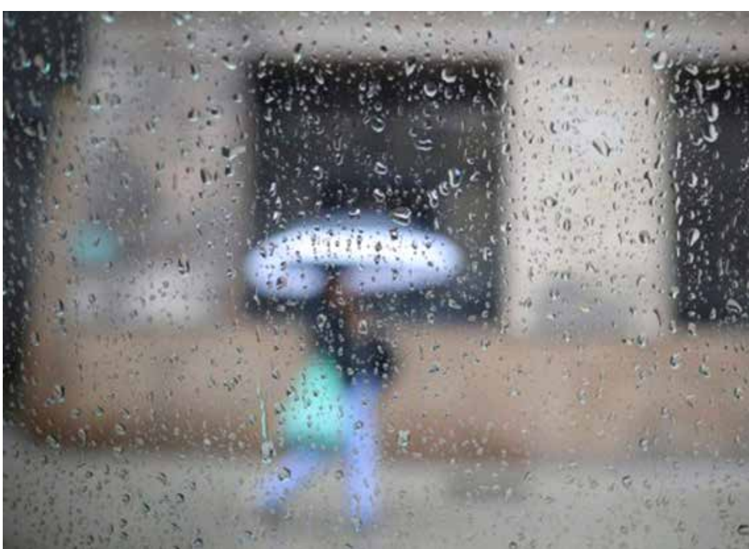
As chuvas mais fortes ocorrerão na terça e estarão concentradas no oeste do estado

As chuvas mais fortes devem ocorrer nesta terça-feira e estarão concentradas no oeste do estado, próximo à divisa com o estado do Paraná.