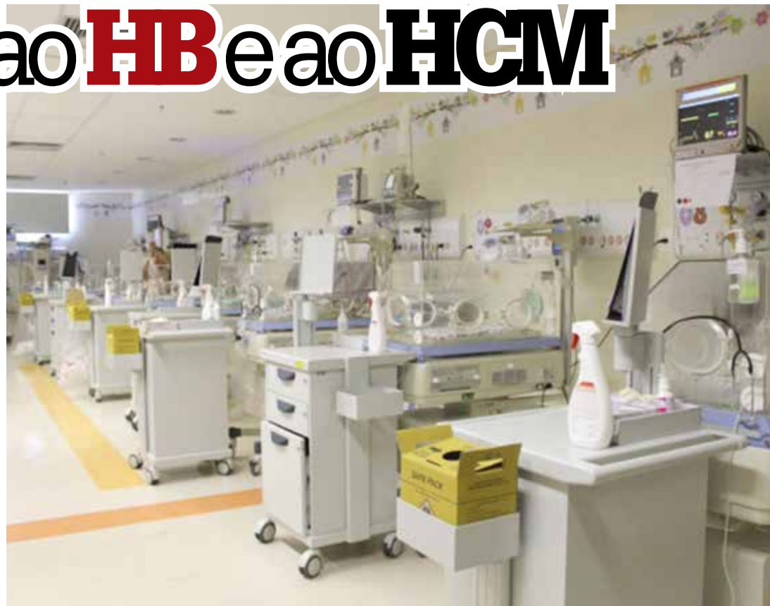
UTI neonatal do Hospital da Criança e Maternidade (HCM) de São José do Rio Preto