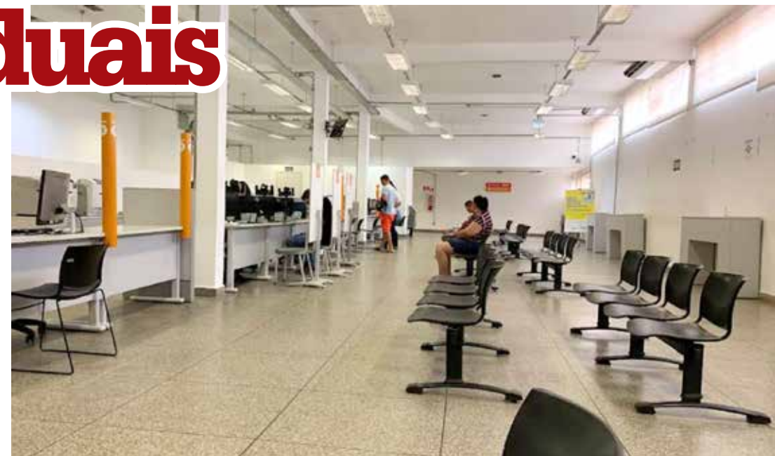
Vista interna da unidade do Poupatempo de Fernandópolis

Atualmente, o programa conta com 244 postos de atendimento presencial e 900 totens de autoatendimento, distribuídos