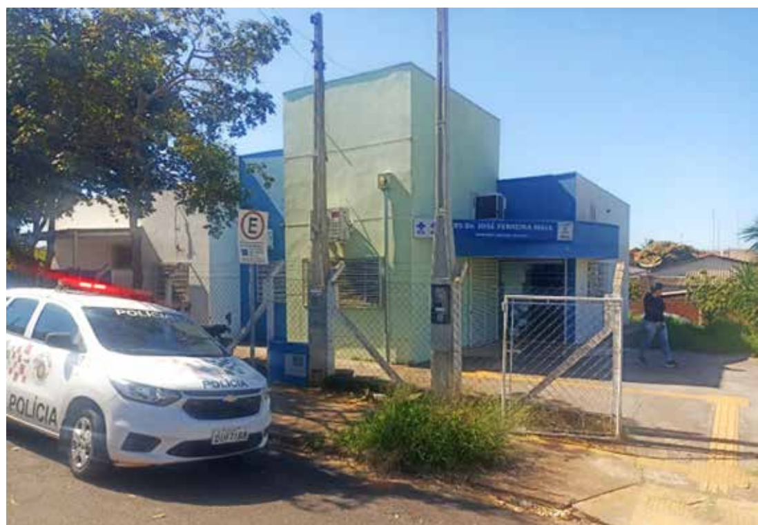
Unidade de Saúde do Rosa Amarela

acesso rápido a serviços de proteção; • Ministério Público e Defensoria Pública: para orientação jurídica e acompanhamento dos casos. As autoridades também