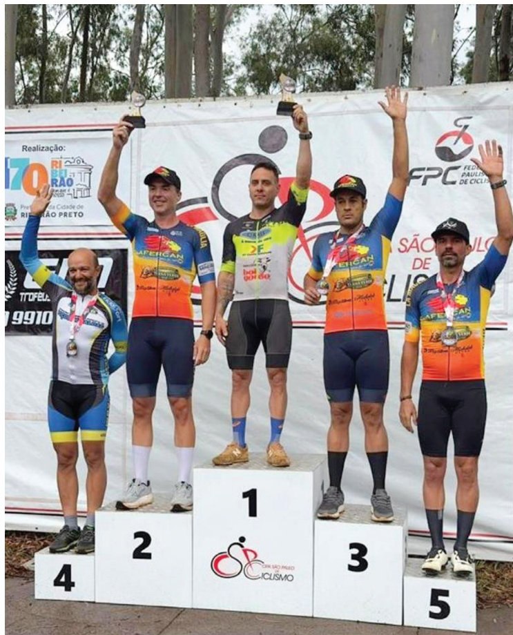
pos, o time da AFERCAN também acelerou forte, chegando novamente ao pódio. Na Categoria