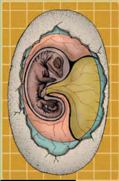
^ Ovo amniótico

O ovo amniótico revolucionou a história da vida porque permitiu aos vertebrados ocupar a terra firme. Eles não mais precisavam de rios, lagos e poças para depositar seus ovos.