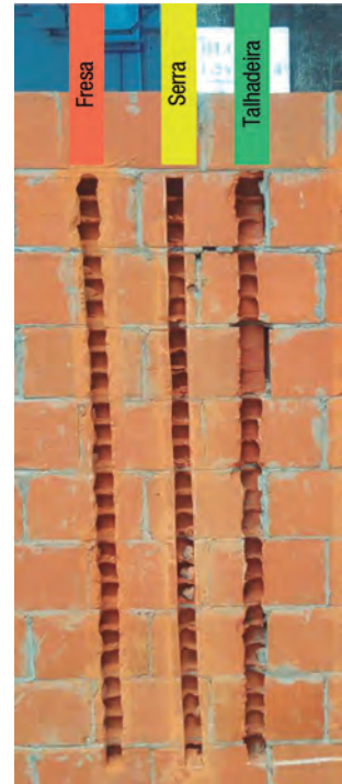
Fig. 2.1 Fotografia dos rasgos executados com três diferentes tipos de ferramenta de corte e respectivas características

Na análise de uma construção, realizar a ACV consistiria em avaliar a origem de todos os materiais utilizados na execução dessa construção, os processos de reformas da edificação, e o que fazer ao fim de sua vida útil.