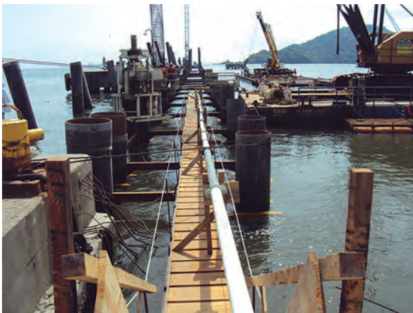
Fig. 1.1 Obra portuária em construção

Os processos geradores de resíduos da indústria da construção civil são bastante variáveis e complexos. Em seu sentido mais amplo, a indústria da construção civil gera resíduos na construção, em reformas e desconstrução/demolição de empreendimentos (edifícios, obras de infraestrutura, barragens etc.) e nas atividades que dão suporte ao setor (fornecimento de bens e serviços). Para sua compreensão, deve-se avaliar como o empreendimento é construído/desconstruído. Com base na Fig. 1.1, seria possível imaginar que resíduos de construção estão sendo gerados?