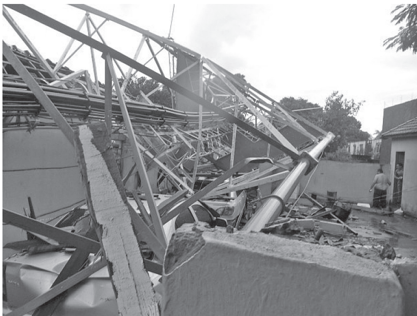
Figura 1.1 – Torre de telecomunicações que ruiu sob o carregamento de vento.

Se a aplicação dos esforços é feita de maneira lenta, com velocidades desprezíveis, é usual não levar em conta o aparecimento de forças de inércia. O estudo dessas estruturas é feito de forma quase estática, a maioria das vezes desconsiderando o efeito dos movimentos sobre o equilíbrio (análise geometricamente linear) e sobre o comportamento dos materiais. Caso contrário, podem resultar movimentos oscila-