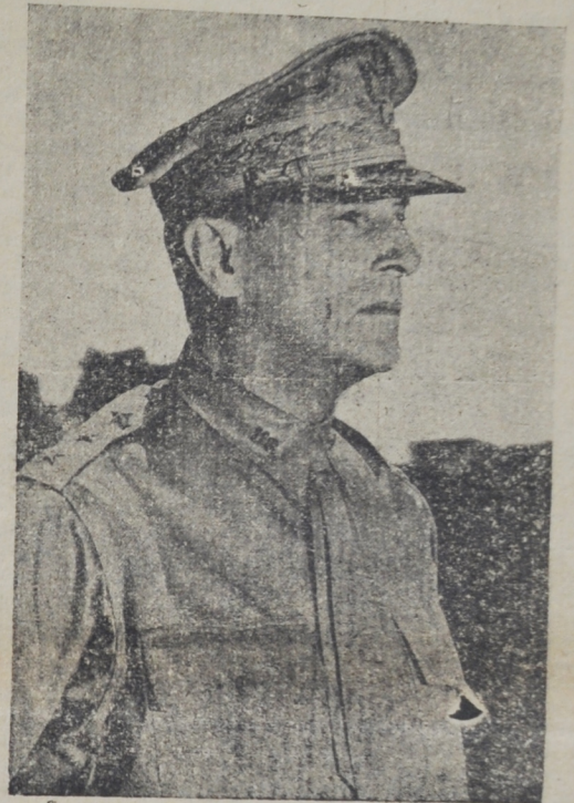
GAL. DOUGLAS MAC-ARTHUR

Após a entrada das tropas «yankees» em Tokio, o Gal. Mac-Arthur assiste impressionante cerimonial