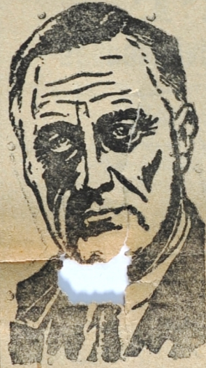
FRANKLIN D. ROOSEVELT

Transcorreu, ontem, a data aniversária do Presidente Roosevelt. O fato, em si, não mereceria destacar-se do curso normal dos fatos quotidianos, se não marcasse o início de mais um marco na vida de um homem cuja atuação no cenário da história contemporânea tem sido, em toda a sua trajetória um exemplo decisivo de