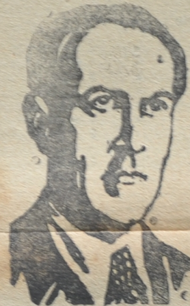
DR. OSWALDO ARANHA

ção ao Sr. Washington Luiz. Vitoriosa a causa, foi-lhe confiada a pasta da Justiça, onde sua cultura, destemor e dedicação á causa pública mais uma vez se fizeram conhecer. Passa, logo depois, para o Ministério da Fazenda, secretaria em que pôz a prova, ainda mais, seu amor ao nosso país, implantando, ali, normas rígidas na Fazenda Pública, praticando a justiça, sendo forte, quando necessário. Embaixador do Brasil em Washington, nos Estados-Unidos, a nossa representação no país vizinho teve destacada atuação, ganhando grande simpatia para a nossa Pátria, mercê de suas elevadas qualidades pessoais, muito admiradas, ainda hoje na terra do dollar. Volta, de-