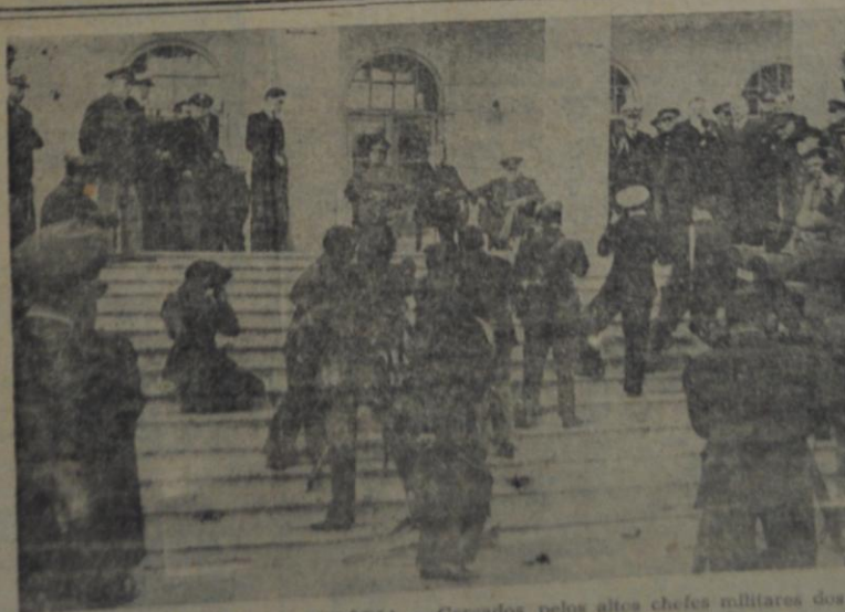
A CONFERENCIA DA VITÓRIA — Cercados pelos altos chefes militares dos EE. UU., U. R. S. S. e Grã-Bretanha, os líderes destes três grandes países aliados tomaram soluções da maior importância para o prosseguimento da guerra e consequente derrota de Hitler, durante a recente reunião de Teerã, muito justamente chamada de «Conferencia da Vitória». A fotografia que estampamos fixa um aspecto da conferencia, com o Marechal Stalin, o Presidente Roosevelt e o premier Churchill pensando para os fotografos e cinegrafistas, cercados por altas patentes militares presentes às deliberações.

RIO, 31 (A. N.) — Realiza-se hoje a cerimônia de entrega à marinha Brasileira dos primeiros motores «Diesel» construídos nas oficinas da Central do Brasil para o caça-submarino Rio Fardo .