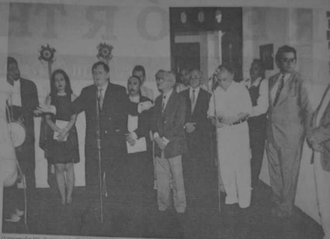
O governador Mito Naves na solenidade de inauguração da sede da UBE, com a participação de toda a intelectualidade piauiense.