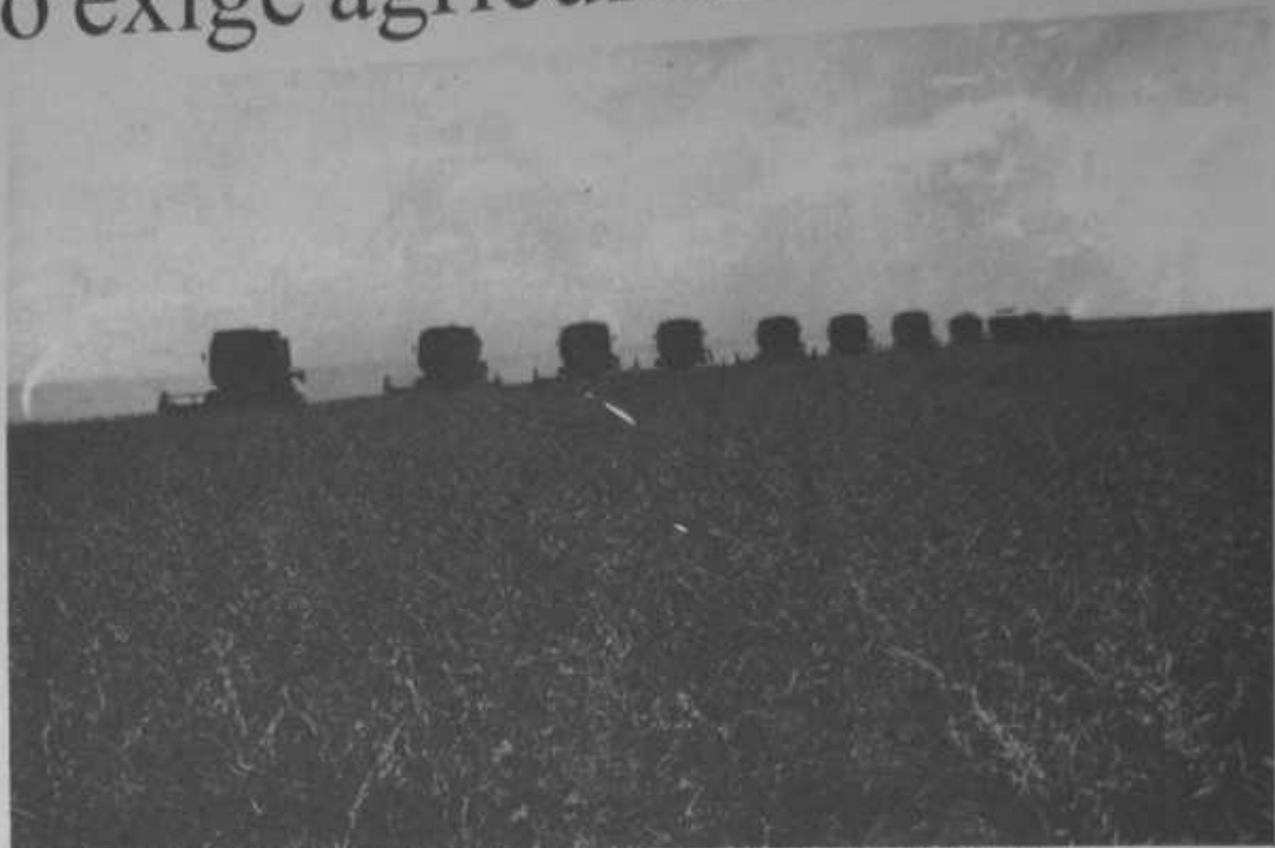
A atual gestão da Secretaria de Agricultura procura representar seu verdadeiro papel

O segmento de pesquisa agropecuária vem sendo desenvolvido pela Empresa Brasileira de Pesquisa Agropecuária, através do CPAMN-Centro de Pesquisa Agropecuária do Meio Norte. Por outro lado, como forma