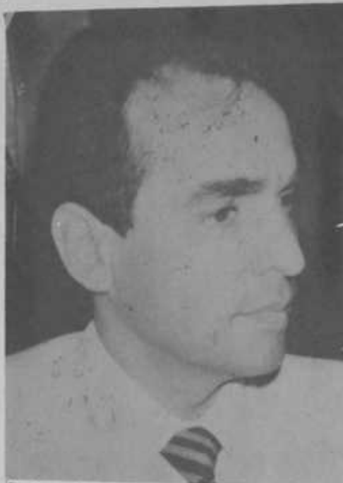
Castro: o IAPEP hoje conquistou credibilidade

nicas, laboratórios e hospitais credenciados; não despertava a menor credibilidade junto aos servidores públicos.