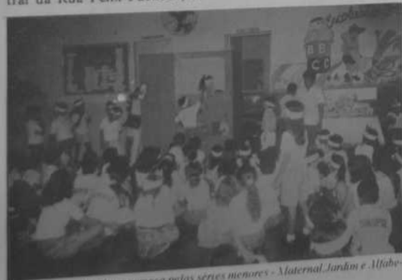
A preparação do aluno começa pelas séries menores - Maternal, Jardim e Alfabetização

O Sinopse começa a trabalhar com crianças desde o Maternal, estendendo suas ações até o nível de pré-vestibular e operando em três unidades na cidade de Teresina. A Unidade Central da Rua Félix Pacheco, a