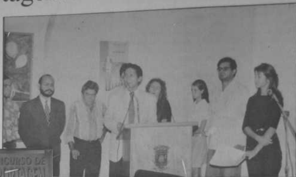
Solenidade de lançamento do concurso Paulo de Tarso Moraes, no Palácio da Cidade