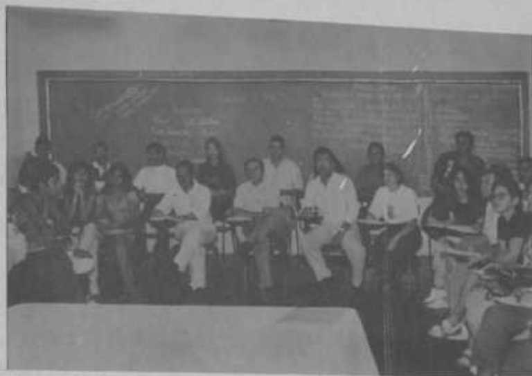
Reunião de Pais e Mestres consolida a parceria para um ensino de qualidade

Dois projetos brasileiros foram apresentados: um sobre a realização de uma nova pesquisa traçando o perfil da saúde do jornalista brasileiro; outro, sobre a proposta de financiamento do vídeo a ser produzido pelos países do Mercosul, mostrando a realidade jornalística de cada um, a regulamentação profissional, o mercado de trabalho e outros temas de interesse da categoria.