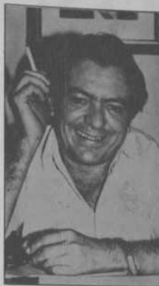
Pires assume até outubro

Mário Rogério se afastou no dia 31 de maio. A legislação eleitoral dava como prazo o dia 02 de junho para que presidentes de sindicatos se afastassem para poder disputar as eleições. Em ofício encaminhado à diretoria, ele comunicou afastamento até o dia 03 de outubro.