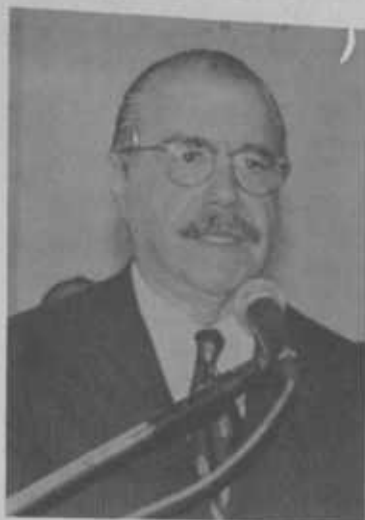
Senador José Sarney

A Fenaj não é contra a punição dos jornalistas que caluniam. Acha apenas que o Código Penal já con-