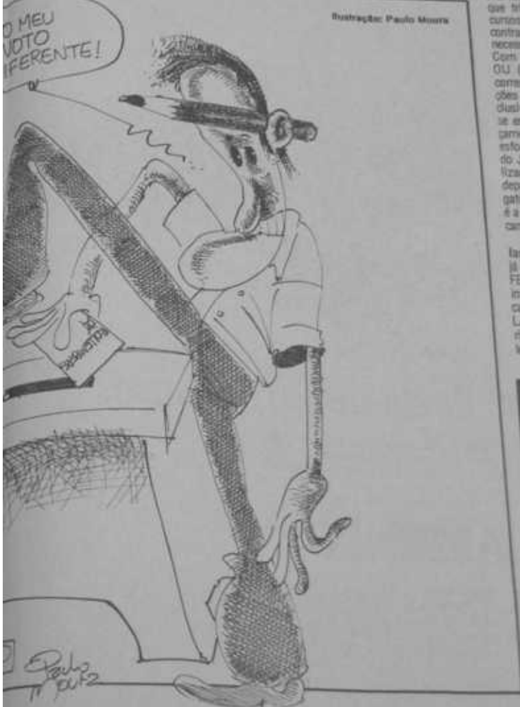
Ilustração: Paulo Moura

os jornalistas irão eleger os novos dirigentes da FENAJ