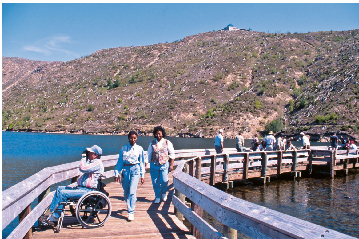
U.S. Forest Service- Pacific Northwest Region

NATIONAL PARK SERVICE. Tour Hearing Impaired. Wind Cave. Disponível em: < www.nps.gov/wica/planyourvisit/tour-hearing-impaired.htm >. Acesso em: 10 nov. 2018.