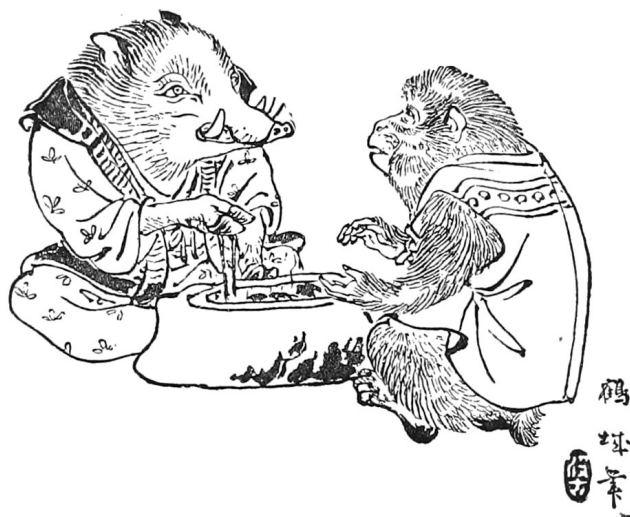
Kakuzō Fujiyama/ Bradbury, Agnew, & Co. Ltd./Archibald Constable & Co. Ltd