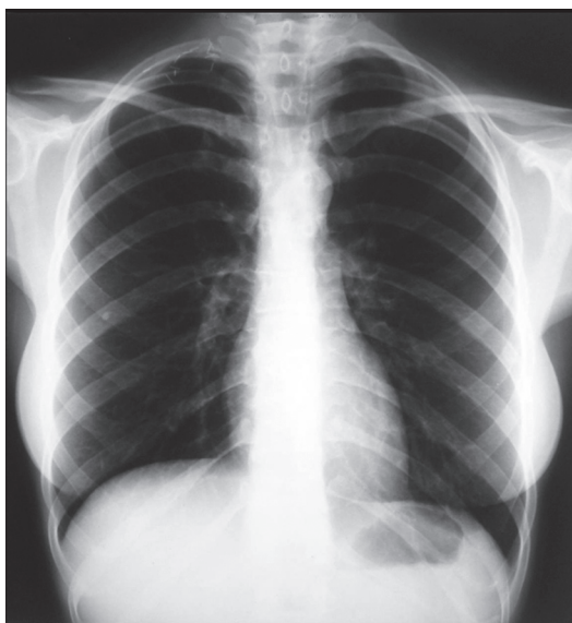
Figura 2 – Radiografia no oitavo dia de pós-operatório, demonstrando ausência de derrame pleural, clips metálicos e a ausência da primeira costela direita.

Durante a liberação da inserção clavicular do músculo esternocleidomastoideo foi observado um extravasamento de conteúdo linfático, atribuído à ruptura de um vaso linfático transitando posteriormente. Apesar da exploração minuciosa, não foi possível a visualização do vaso linfático roto, sendo realizada sutura em bloco dos tecidos fasciais sob o músculo esternocleidomastoideo com polipropileno 5.0, local onde se originava o acúmulo de linfa, seguida de ressecção da primeira costela e da costela