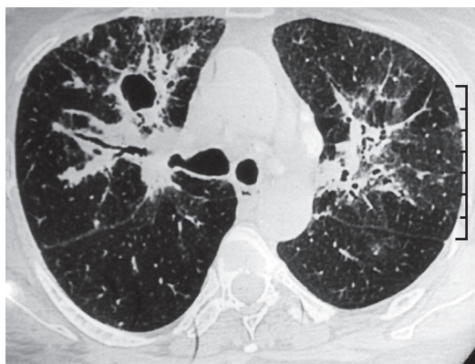
Figura 2 - TC de tórax, obtido 9 meses antes do encaminhamento, mostrando uma lesão cavitária bem definida no segmento anterior do lóbulo superior direito. Feixes broncovasculares com aparência de contas também podem ser vistos.

Uma radiografia de tórax obtida após o encaminhamento revelou linfadenopatia mediastinal persistente com sombras acentuadas do parênquima. No teste de função pulmonar, observamos CVF de 1,45 L (63% do previsto), VEF 1 de 1,05 L (56% do previsto), e razão VEF 1 /CVF de 0,72. A capacidade pulmonar total era de 2,67 L (66% do previsto), e DLCO de 12,53 mL • min -1 • mmHg -1 (68% do previsto), embora a difusão por unidade de volume alveolar estivesse normal. Isso indicava um defeito ventilatório restritivo moderadamente grave,