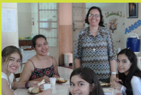
Evento realizado: I Encontro de Jovens Comunicadores. Manaus- AM “Educomunicação e Protagonismo Juvenil na área do Jornalismo e da Fotografia” Pág. 17