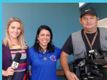
Projeto Canal de Ideias Experiência realizada em Cuiabá, MT- pág. 06