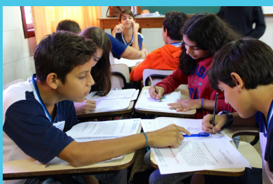
De Olho no Mundo Experiência realizada em Macaé, RJ- pág. 11