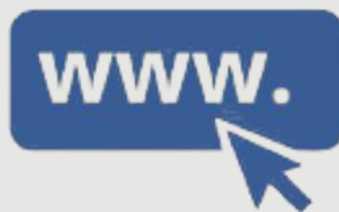
te da Prefeitura ou Câmara