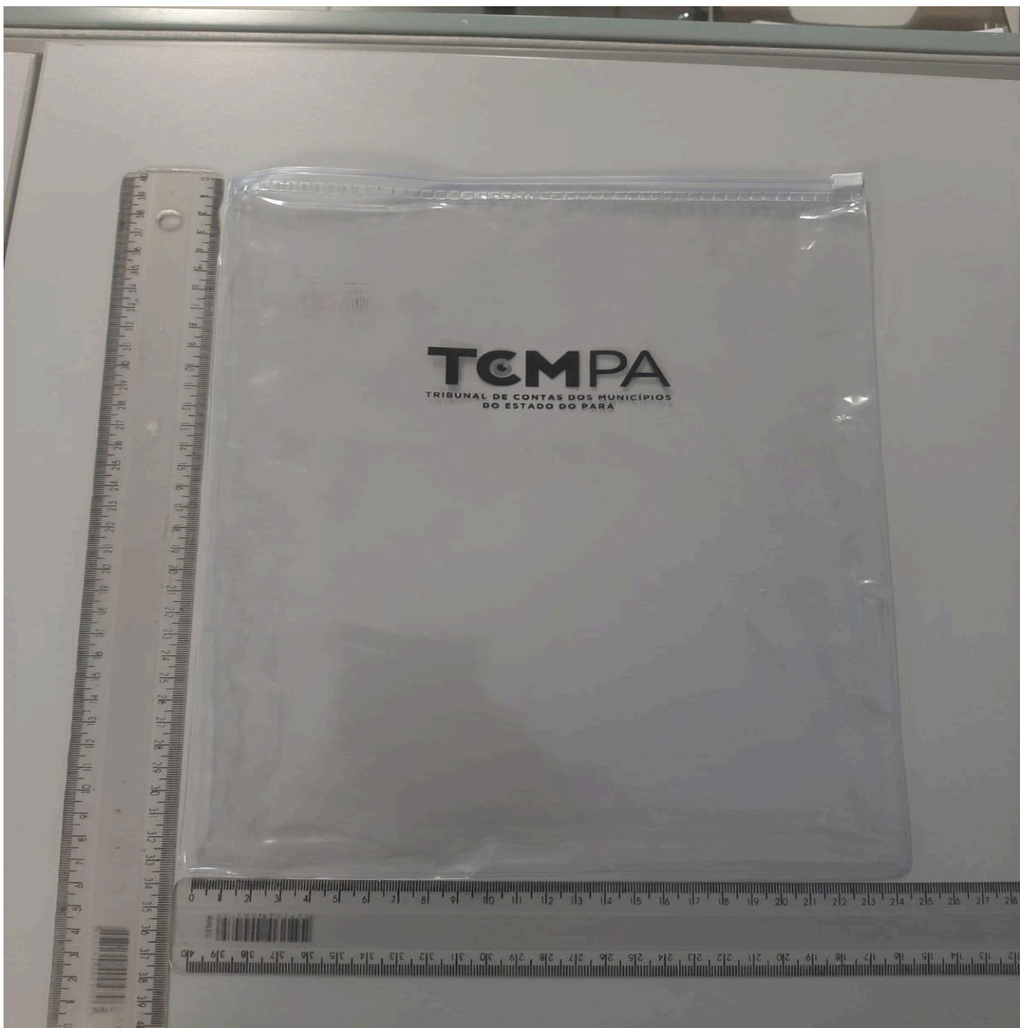
Imagem 02 - Envelope tipo saco, cristal incolor, medindo 34 x 25 cm (fechado)