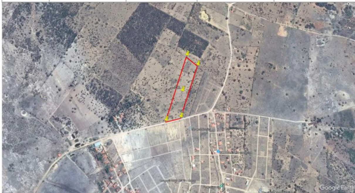
Localização do Terreno