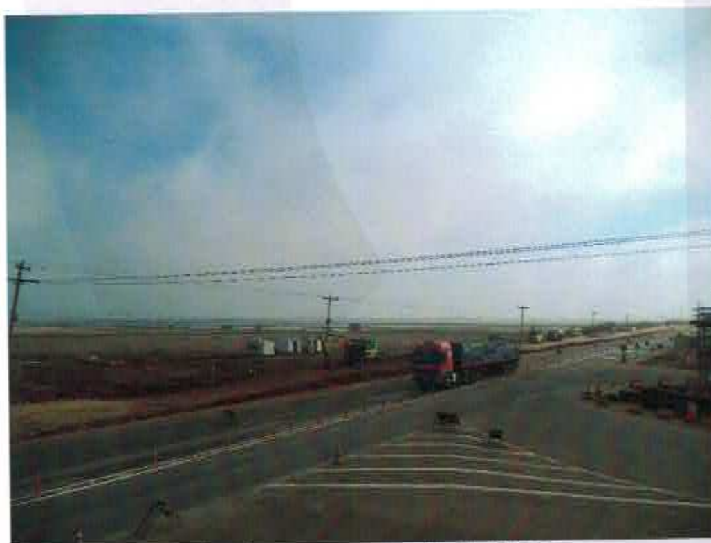
Balizadores para separação de tráfego