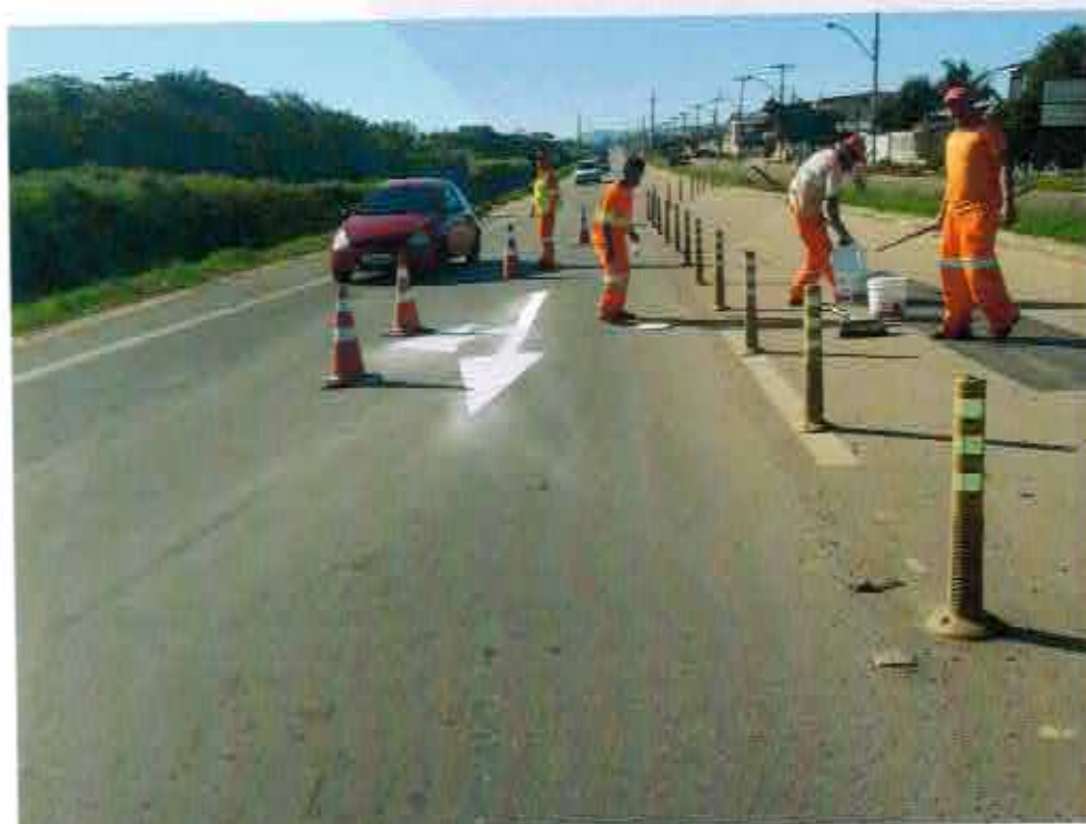
Equipe realizando manutenção da Sinalização