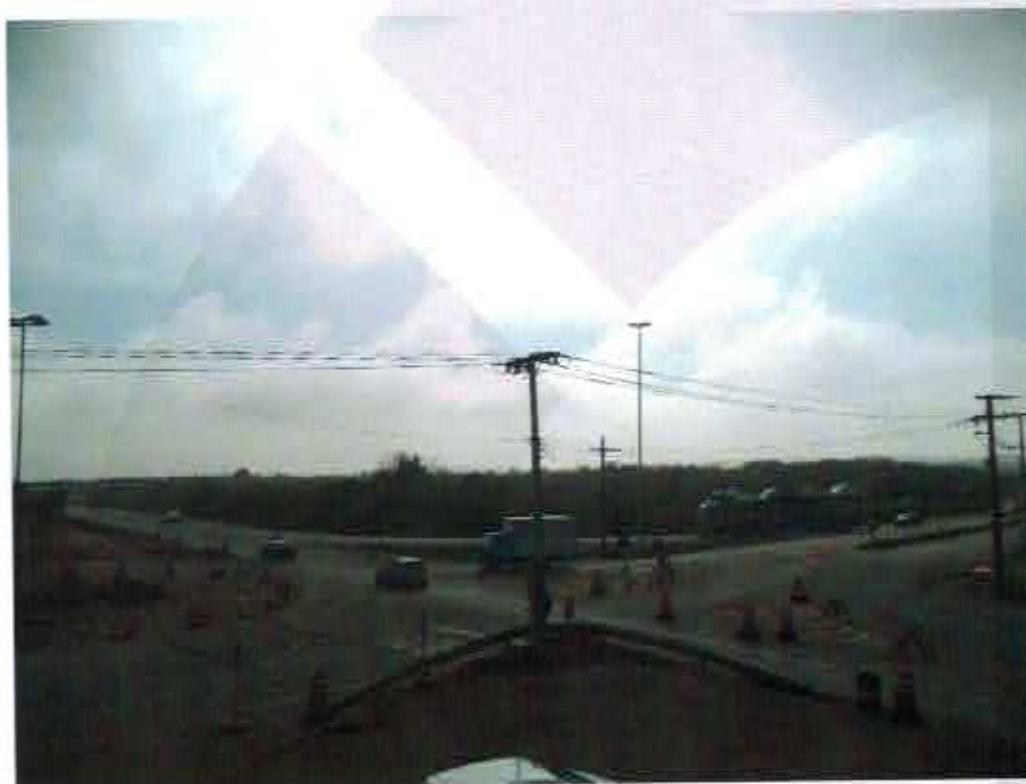
Sinalização do acesso