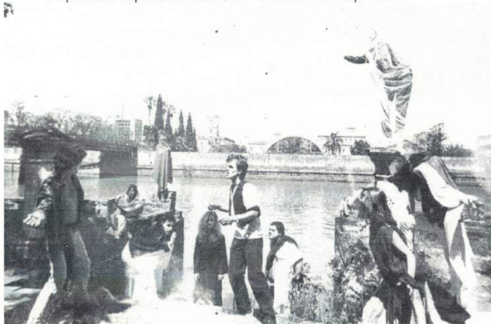
Figura 1: Corpos & Sombras , grupo de teatro de São Leopoldo, anos 80 - performance do primeiro espetáculo chamado "Universo em Expansão"

São Leopoldo, neste escopo, é um município que tem apresentado pioneira e destacada atuação no Estado do Rio Grande do Sul em ações de preservação do patrimônio histórico. Representativo disso é o fato de que se localiza no Município o primeiro bem tombado pelo Estado - a ponte 25 de Julho - protegida após forte movimentação das entidades estudantis e culturais da cidade, parcialmente demonstrada na figura 1.