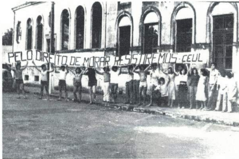
Figura 02: Casa do Estudante Universitário Leopoldense – CEUL.

Na mesma década de 1980, o antigo Seminário Luterano, depois CEUL e atual Câmara de Vereadores (Figura 2), foi tombado como patrimônio histórico.