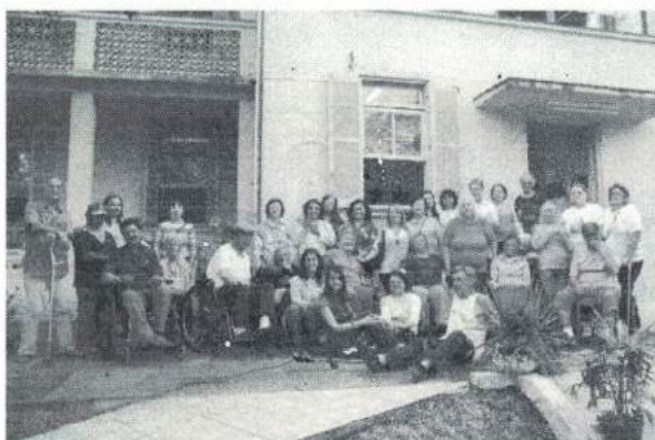
Figura 07: Lar São Municipal Francisco de Assis – Idosos residentes e equipe de profissionais

Desde o primeiro momento do acolhimento de um idoso, se trabalha objetivando que ele construa vínculos fraternos com os outros idosos residentes no Lar, com os trabalhadores, técnicos e o espaço físico, como sua nova casa, seu novo lar. As oportunidades criadas através de espaços amplos para integração, para a individualidade, para o descanso e os festejos são fundamentais para adaptação e o pertencimento.