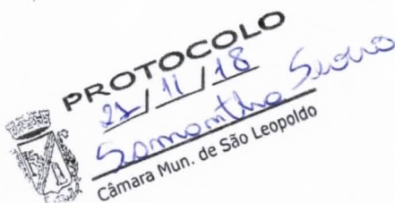
José Luiz Soares Secretário Adjunto Municipal de Gestão e Governo