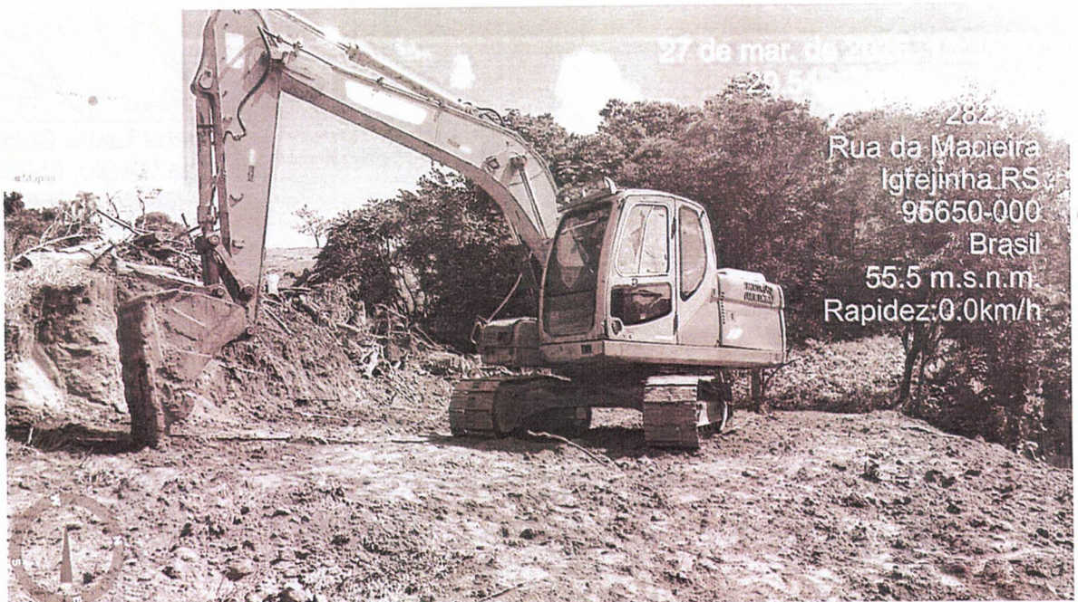
Foto 05: Detalhe dos resquícios de vegetação existente dispostos na área e movimentação do solo.