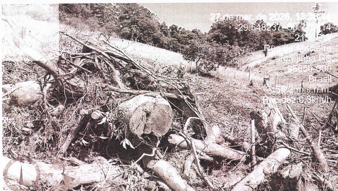
Foto 02: Detalhe dos resquícios de vegetação existente, dispostos na área.