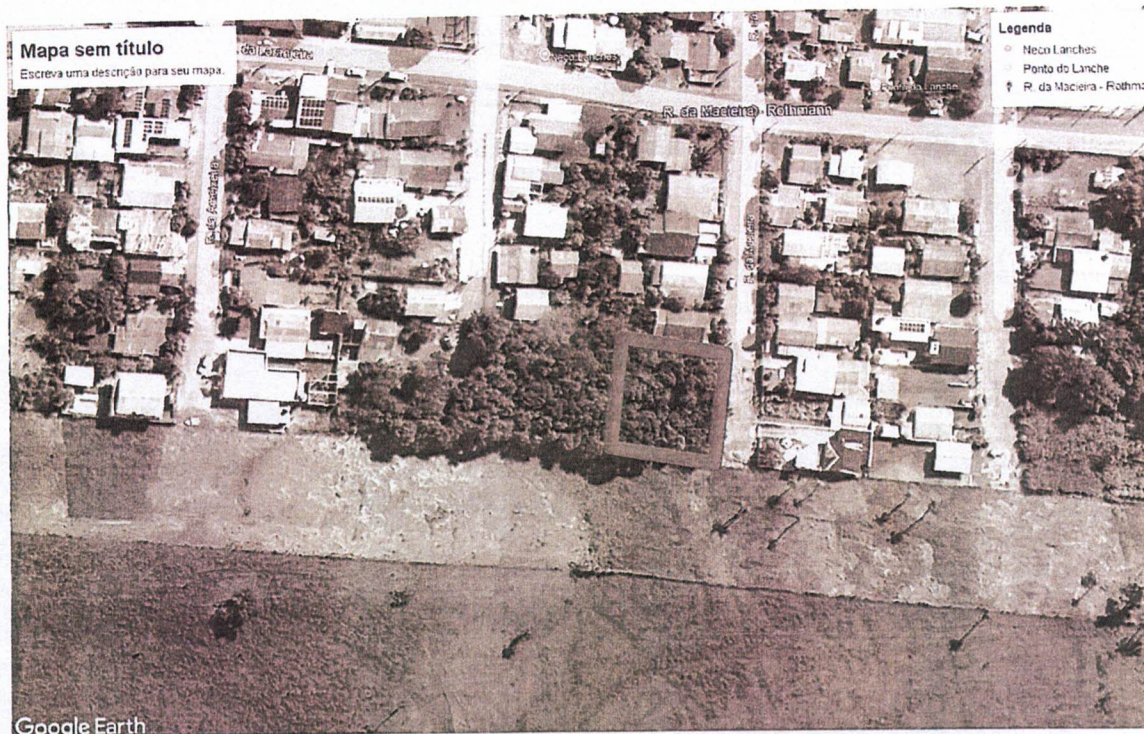
Foto 01: Detalhe no quadrado vermelho, demonstrando o tipo de vegetação existente na área.