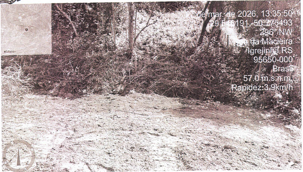
Foto 04: Detalhe dos resquícios de vegetação existente dispostos na área e movimentação do solo.