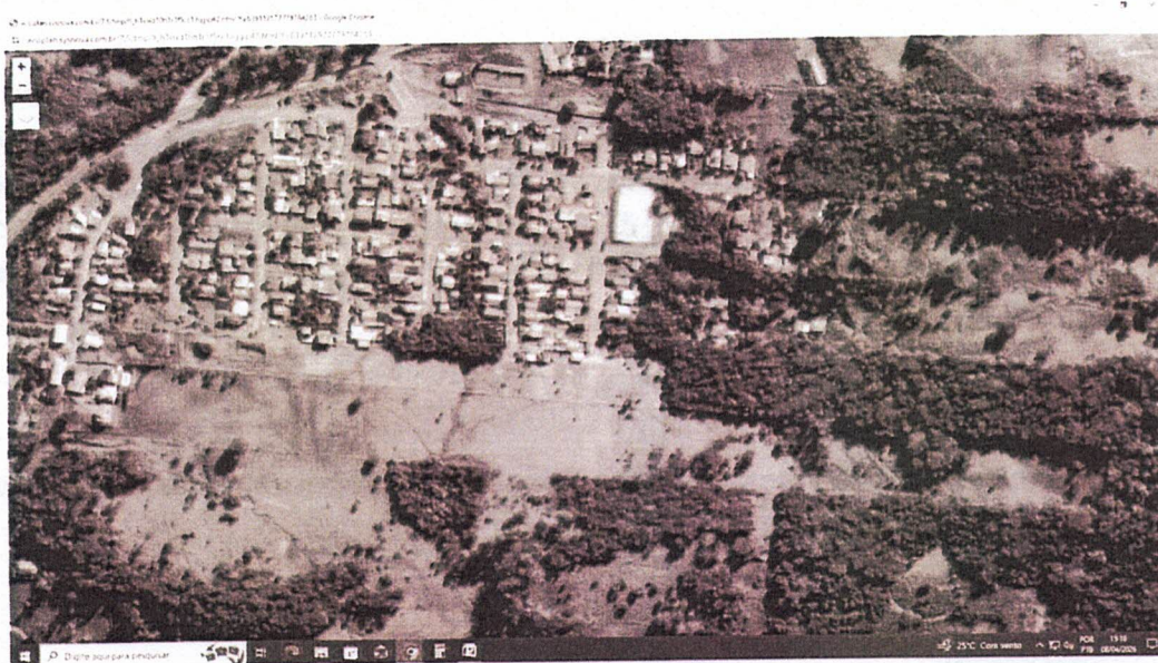
Fig. 1: Local embargado

Fica IMEDIATAMENTE EMBARGADA toda e qualquer atividade de: