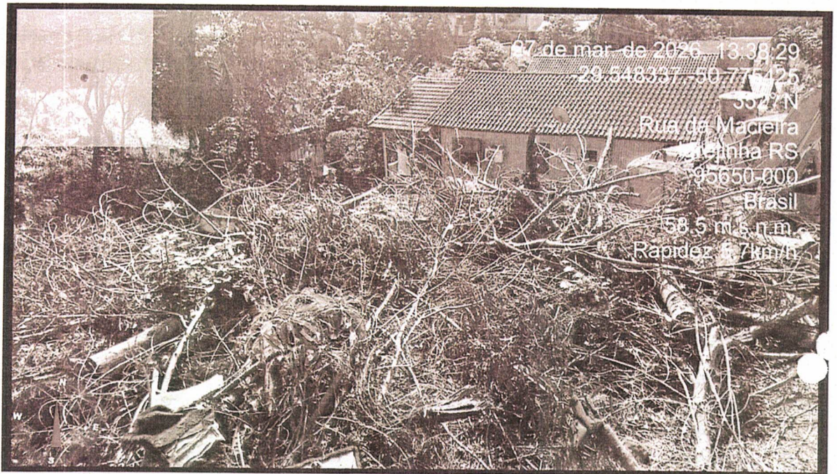
Figura 2: Residências ao final da calha.

Thiago Silveira Fiscal Municipal Matrícula 16029