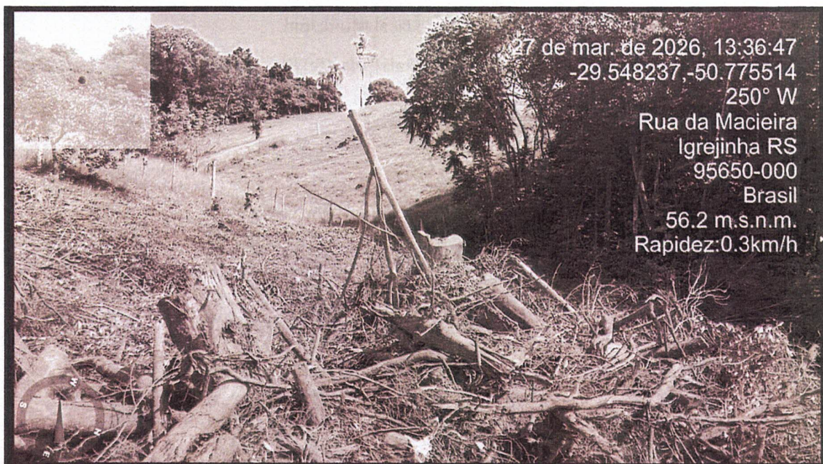
Figura 1: Calha para escoamento de água proveniente da chuva

Em análise posterior, a fiscalização municipal constatou tratar-se de empreendedor dedicado à agricultura de subsistência, em situação de comprovada vulnerabilidade econômica e com baixo nível de escolaridade. Verificou-se, ainda, a existência de uma calha destinada ao escoamento de águas pluviais (Fig. 1), sem conexão com a rede de esgoto pluvial, circunstância que vem ocasionando o alagamento de residências vizinhas ao terreno rural (Fig.2).