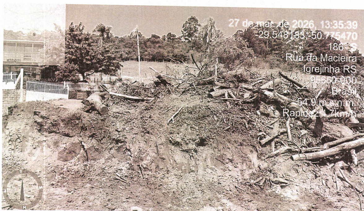
Foto 03: Detalhe dos resqúícios de vegetação existente, dispostos na área.