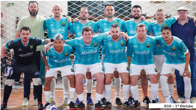
B10 - 1ª Divisão