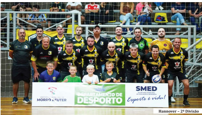
Hannover - 2ª Divisão