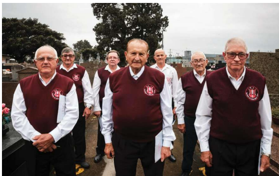
Estas são algumas fotos do ensaio Wurzel

O projeto tem patrocínio master de Calçados Pegada, patrocínio de Killing SA Tintas e Adesivos e Grupo GG10, além de copatrocínio de taQi, Grafidil Impressos, Kinei Calçados e Confecções e Grupo Panvel. O financiamento é viabilizado pelo Pró-Cultura RS, por meio da Lei de Incentivo à Cultura do Governo do Estado do Rio Grande do Sul.