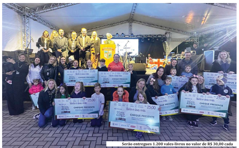
Serão entregues 1.200 vales-livros no valor de R$ 30,00 cada