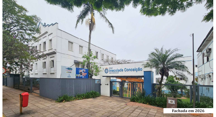
Fachada em 2026