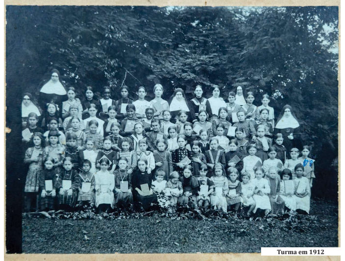
Turma em 1912

No dia 4 de junho, o Colégio Imaculada Conceição celebra 126 anos de uma trajetória que se entrelaça com a história e o desenvolvimento de Dois Irmãos e região. Desde sua fundação, em 1900, a instituição acompanha as transformações da sociedade, contribuindo para a formação de gerações de cidadãos, profissionais, lideranças e famílias que ajudam a construir uma comunidade cada vez mais forte, humana e preparada para os desafios do futuro.