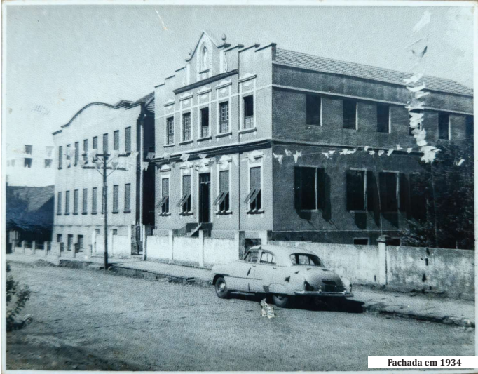
Fachada em 1934